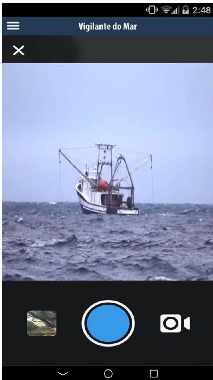
Fig.3 – Anexar Foto: para anexar uma foto na denúncia deverá clicar a opção “Anexar foto?”. O aplicativo será redirecionado à câmera do celular.

A denúncia deverá ser confirmada pressionando o botão ENVIAR após anexar ou não a foto e será enviada automaticamente para o SAPERJ quando o celular estiver dentro do alcance de um sinal 3G, 4G ou Wi-Fi.